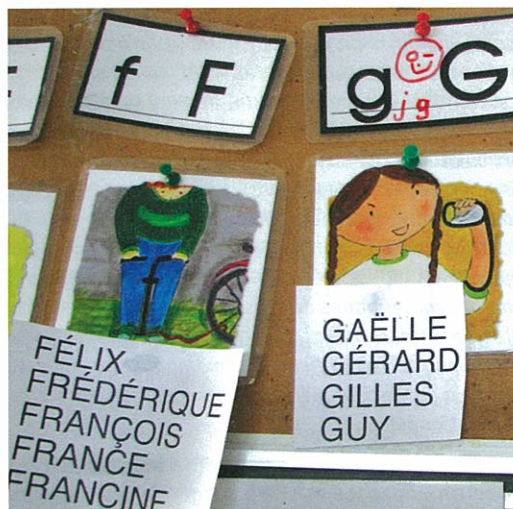
Prénoms de camarades et de parents

Cette connaissance de la langue orale, qui s'est « naturellement » construite depuis la naissance, doit être considérée comme les fondements pour