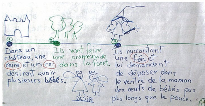
Création d'un conte collectif